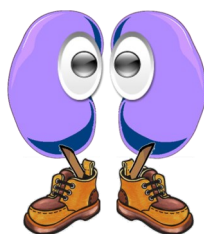
Patient diabétique et/ou vasculaire