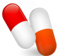
Inhibiteur du SRA (IEC OU ARA2)

Un traitement néphroprotecteur est INDISPENSABLE dans TOUTES les Maladies Rénales Chroniques y compris aux STADES 4 ET 5 de l'IRC même en cas de STENOSE des artères rénales.